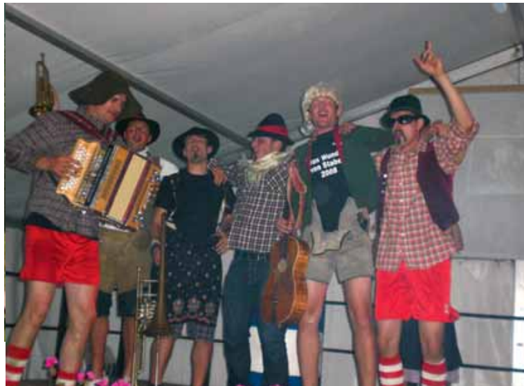
Mit Spaß dabei: Einige Spieler des FC Sand 93 als Zillertaler Schürzenjäger

dass wir 2020 dann unser erstes FC Sand 93-Juniorteam auflaufen lassen können. Am Aufbau wird jetzt schon fieberhaft gearbeitet.